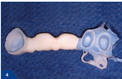
4 Entnahme der Restauration nach Ende der Abbindezeit