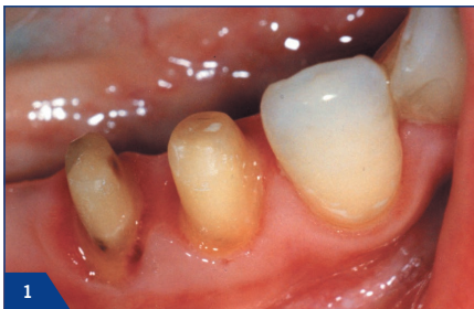
1 Ausgangssituation nach erfolgter Präparation