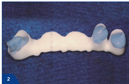
2 Befüllen der Kronenlumen mit Fit Test C & B