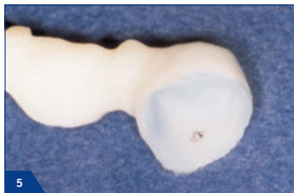
5 Darstellung von Passungenauigkeiten sowohl in der Restauration ...