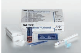
Scotchbond™ Universal Adhäsiv Intro Kit Flasche