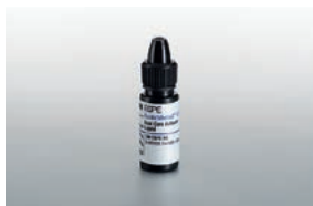
Scotchbond™ Universal DCA