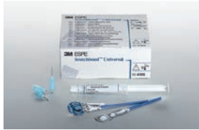
Scotchbond™ Universal Adhäsiv Intro Pack L-Pop