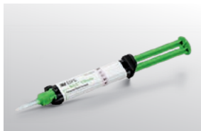
RelyX™ Ultimate Adhäsives Befestigungscomposite