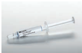
Scotchbond™ Universal Ätzel