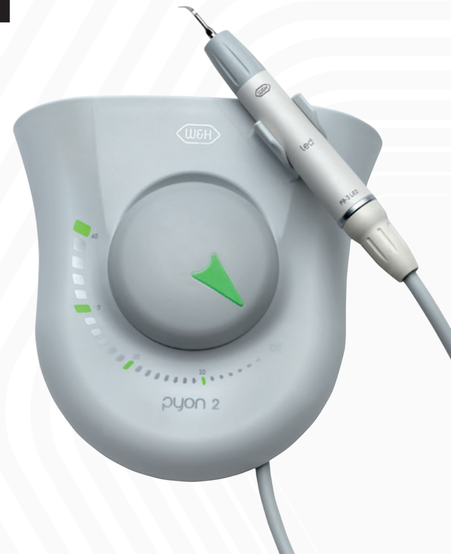
Abb. Symbolfotos. Zusatzausstattung und Inhalt der gezeigten Zubehörteile sind nicht im Lieferumfang enthalten.

20311 ADT Rev. 005 / 05.09.2019 Änderungen vorbehalten