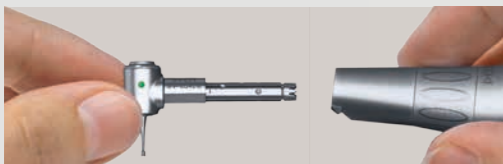
Helppo vaihtaa: KaVo INTRA -kulmapäät sopivat kaikkiin KaVon runkoihin.